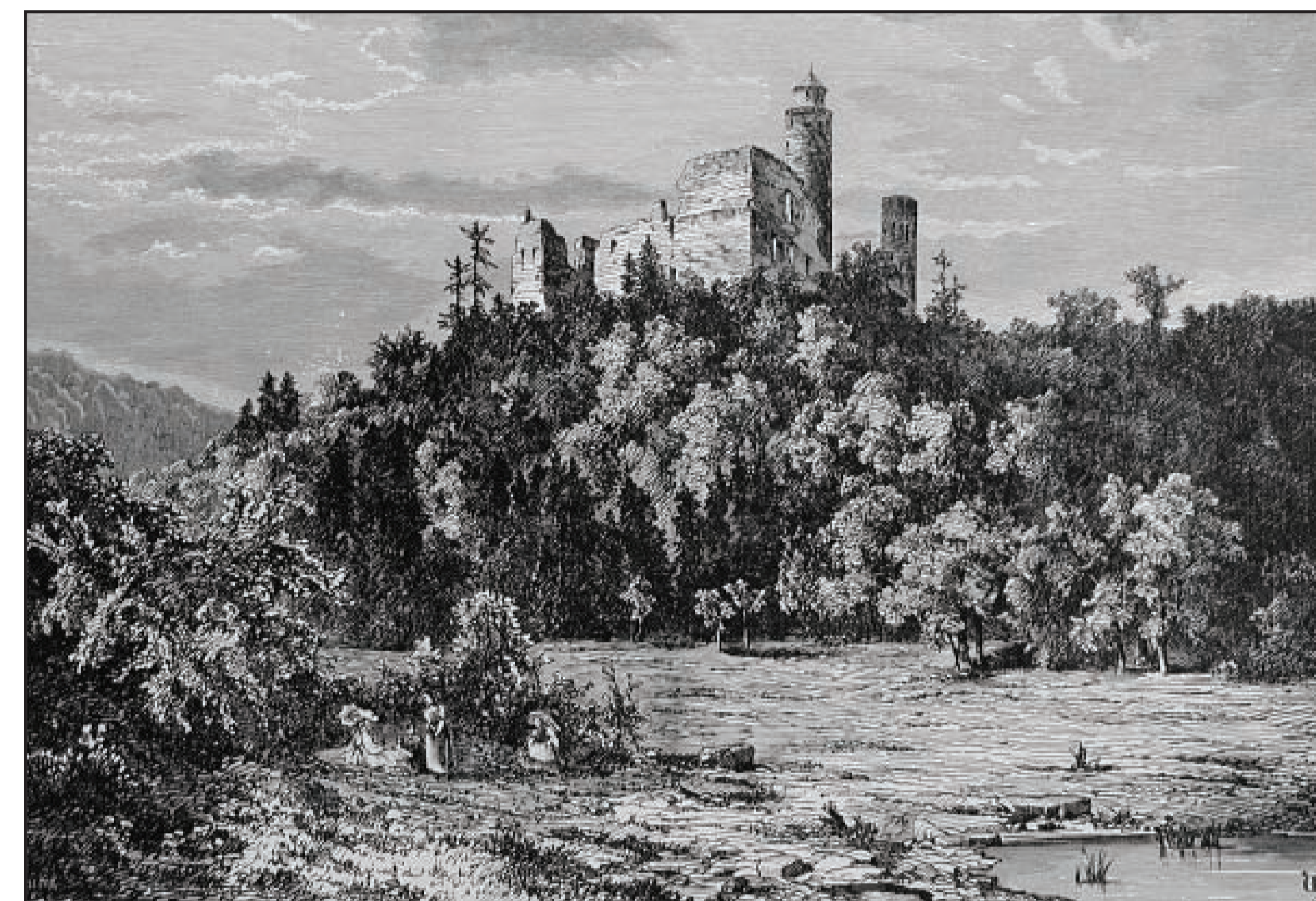
hrad na kresbě H. Ullika z poloviny 19. století Die Burg auf einer Zeichnung von H. Ullik aus der Mitte des 19. Jahrhunderts